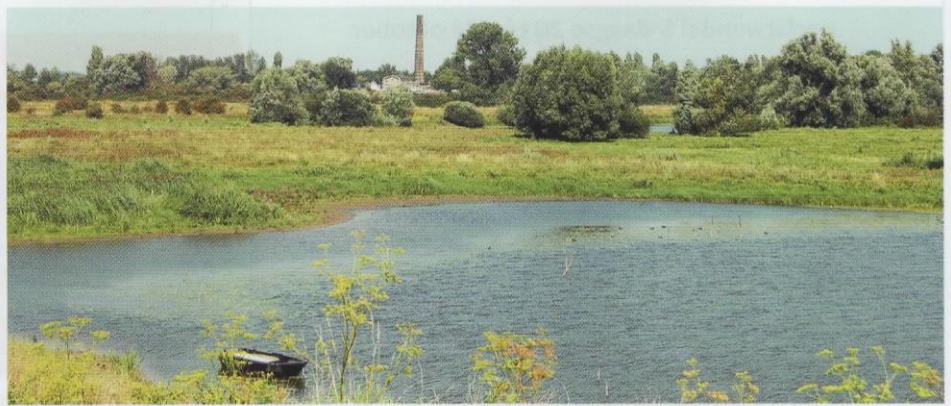
^ Schoorsteen van voormalige steenfabriek De Ooij vanaf de Ooijse Banddijk

Naast de uitzichtoren bevindt zich een met water gevuld betonnen gevaarte dat veel weg heeft van een geschutskoepel. Een