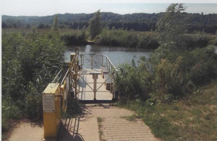
▲ Voetveer bij natuurgebied 't Zwanenbroekje