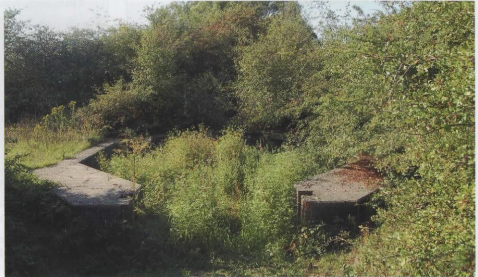
^ Verdedigingspunt IJssellinie; in het beton zat de geschutskoepel van een Sherman-tank