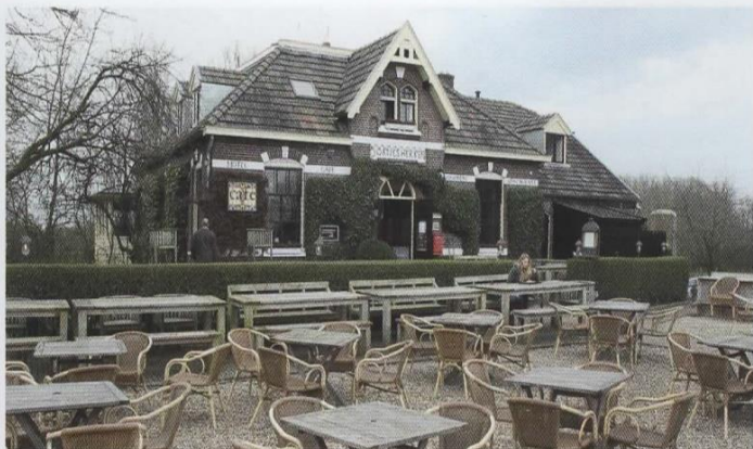
▲ Huiskamercafé Oortjeshikken