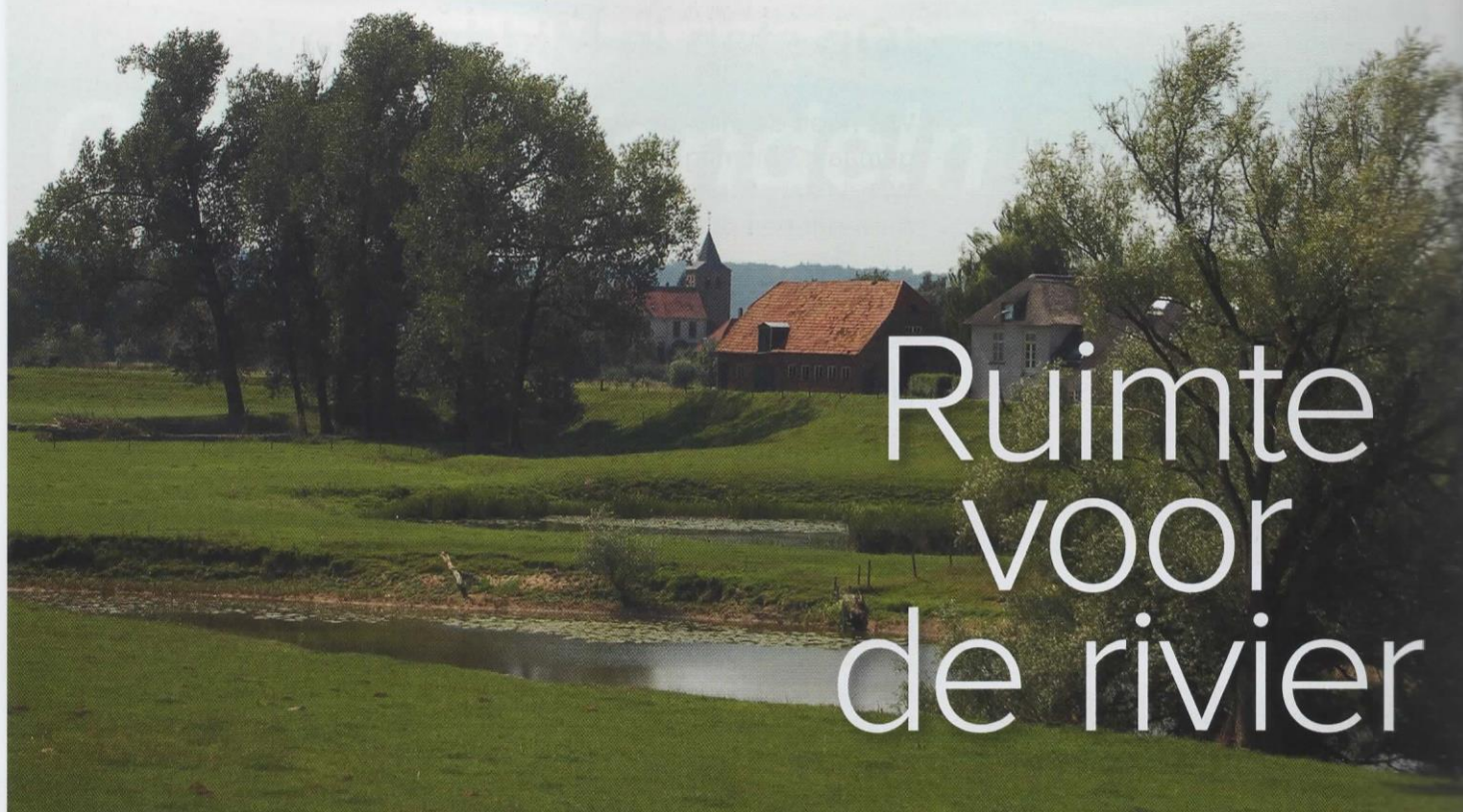
▲ Het oude dorp Ooij met zijn kerk op een pol

Een nieuwe voetgangersbrug verbindt de stad Nijmegen met de Ooijpolder, een natuurgebied dat bijzonder erfgoed bevat. Restanten van steenfabrieken en overblijfselen van een verdedigingslinie uit de Koude Oorlog. Genoeg redenen voor een bezoek.